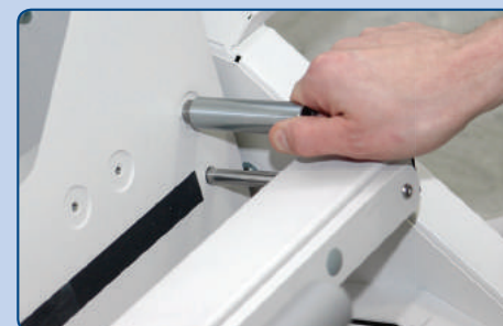
Vordefinierte Stellen für den Papierstopper