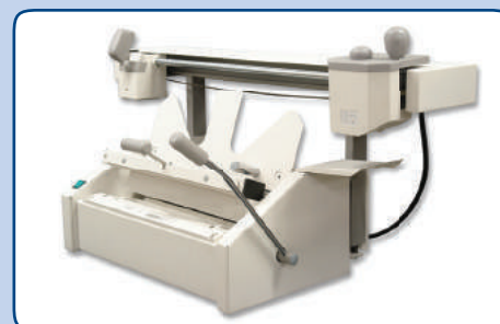
Tischbindemaschine nach Bedarf