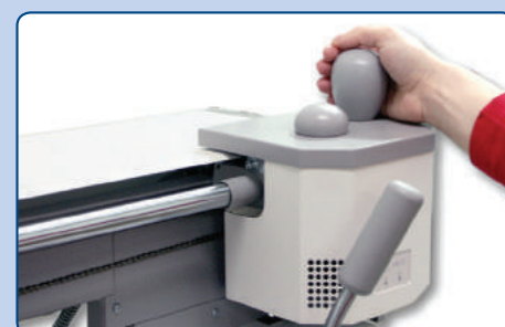
Einfaches und sicheres Auftragen von Leim